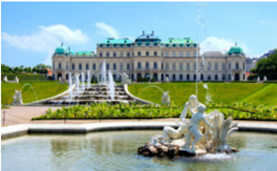
Palácio Belvedere, Viena.