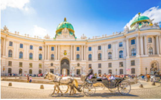
Palácio Imperial de Hofburg, Viena.