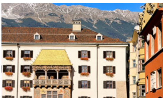
Telhado de Ouro, Innsbruck.